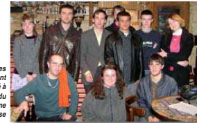
L'équipe des jeunes ayant participé à l'écriture du programme Jeunesse

La culture de rue ne doit pas non plus être oubliée, des murs d'expression seront installés pour que chacun puisse exprimer sa créativité.