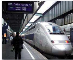
Quand serons-nous à moins d'une heure de Paris ?