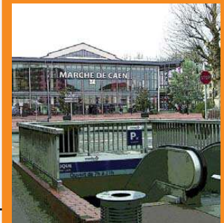
IMAGE DE SYNTHÈSE DU MARCHÉ COUVERT, PLACE DE LA RÉPUBLIQUE

Pour renforcer l'attractivité du centre ville, nous proposons de créer un marché couvert ouvert tous les jours et dédié aux produits régionaux et à l'agriculture biologique.